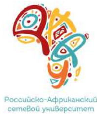
Российско-Африканский сетевой университет