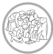
Политехнический университет Милана